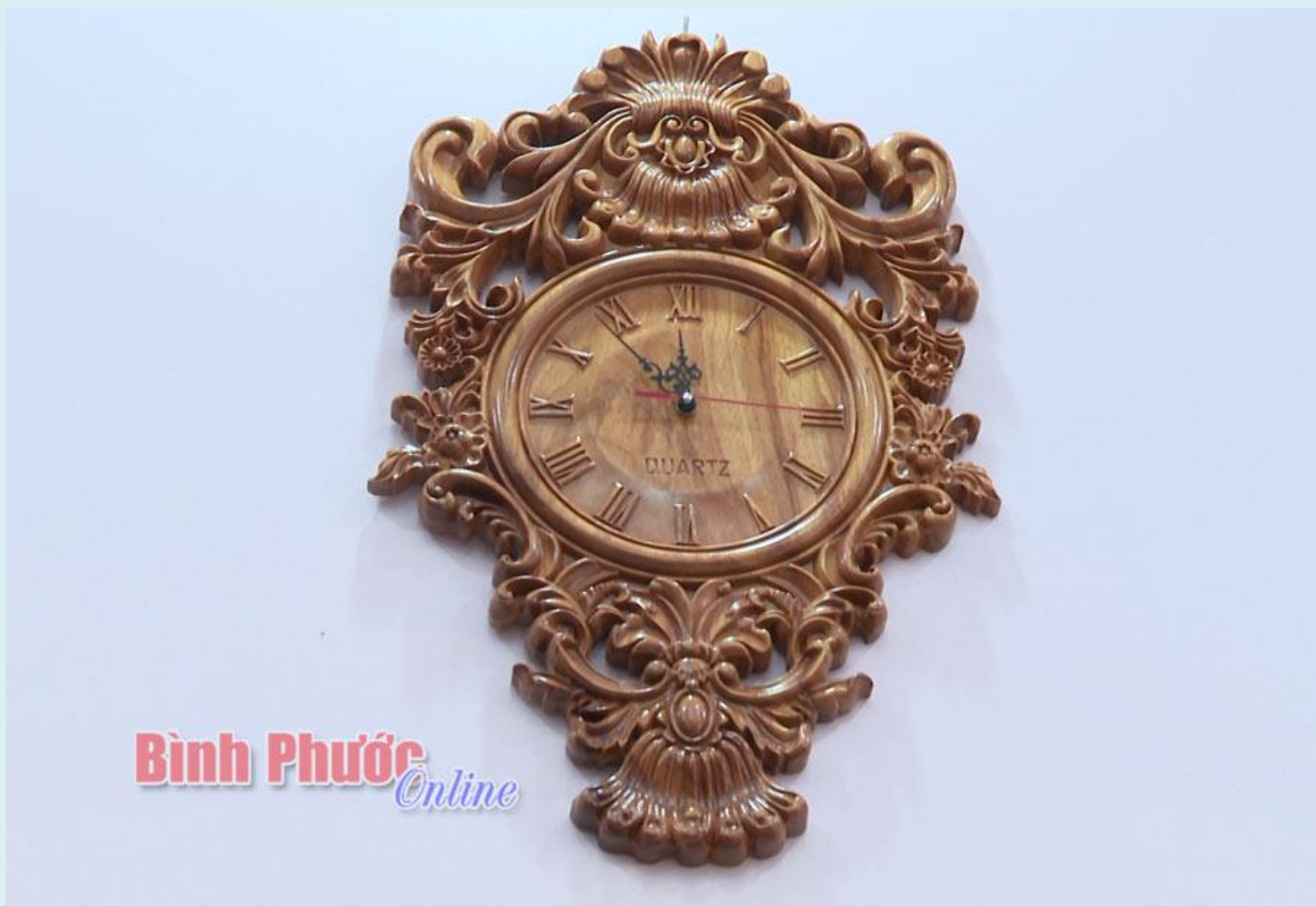
Một trong những sản phẩm “hút hàng” của xưởng gỗ mỹ nghệ Trường Thảo

Phụ trách mảng kinh doanh của xưởng, anh Trường rất chú trọng việc quảng cáo trên các trang mạng xã hội Facebook, Zalo và mạng lưới cộng tác viên. Sau gần 2 năm lăn sân thị trường đồ gỗ mỹ nghệ, xưởng gỗ mỹ nghệ Trường Thảo đã có mạng lưới cộng tác viên bán hàng online gần 20 người rộng khắp các tỉnh trong khu vực Đông Nam bộ và một số tỉnh phía Bắc. Đa dạng sản phẩm tranh treo tường, tượng gỗ, tranh chữ... với thiết kế tinh xảo, giá cả phải chăng, các sản phẩm của xưởng gỗ mỹ nghệ Trường Thảo đã gây được tiếng vang trong và ngoài tỉnh. Hiện doanh thu của xưởng đạt bình quân 20-30 triệu đồng/tháng. Anh Trường cho biết: Thời gian tới, xưởng sẽ tiếp tục mở rộng chuỗi sản xuất khi có thêm vốn. Đồng thời đầu tư các loại máy công suất lớn, hiện đại và nhận thêm đội ngũ cộng tác viên bán hàng để nhiều người tiếp cận được sản phẩm gỗ mỹ nghệ cao cấp.