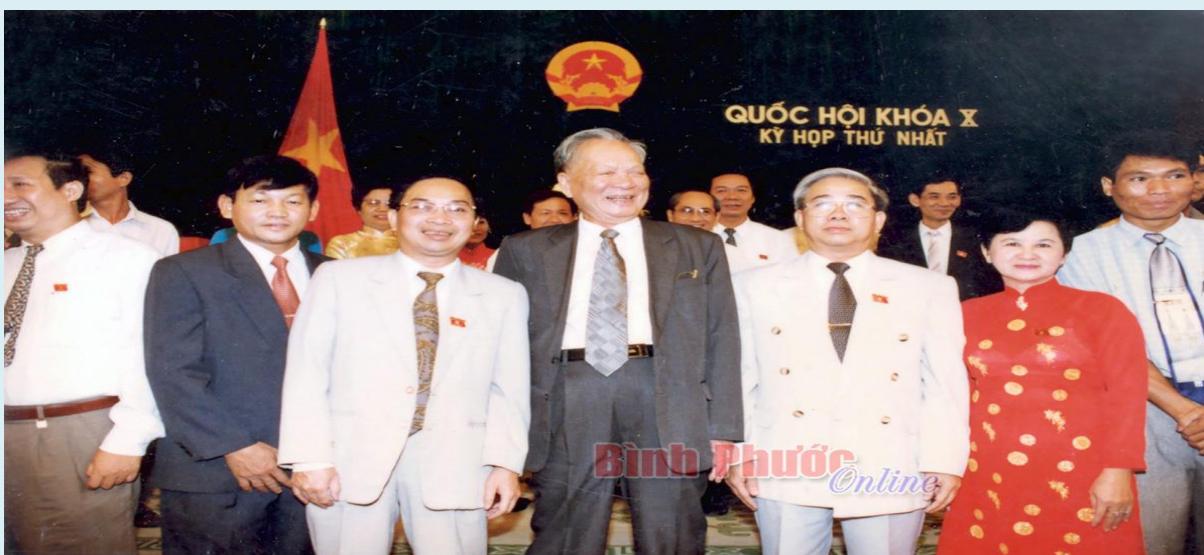
Đoàn đại biểu Quốc hội tỉnh Bình Phước chụp hình lưu niệm cùng Chủ tịch nước Lê Đức Anh

Về tình hình chung của tỉnh sau 1 năm triển khai thực hiện Nghị quyết số 01-NQ/TU, Tỉnh ủy đã tập trung củng cố, sắp xếp, xây dựng, hình thành bộ máy Đảng, chính quyền, MTTQ và các đoàn thể cấp tỉnh. Do còn thiếu một số ngành khi chia tách từ tỉnh Sông Bé, tỉnh thành lập 15 đơn vị cấp tỉnh (3 đảng bộ trực thuộc, 5 ban cán sự Đảng, 2 cơ quan hành chính, 4 doanh nghiệp Nhà nước Trung ương và 1 doanh nghiệp địa phương). Đã bổ nhiệm, đề bạt 5 cấp trưởng, 15 cấp phó ngành cấp tỉnh và tương đương; kiện toàn BCH Đảng bộ 5 huyện do việc điều chuyển cán bộ về tỉnh. Lực lượng vũ trang cũng được sắp xếp, củng cố cho phù hợp với yêu cầu xây dựng tỉnh mới.