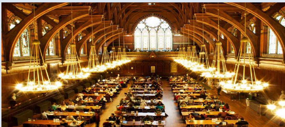
Đại học Harvard

Vẫn trung thành với vị trí thứ 6 là Đại học Harvard (Mỹ). Ngôi trường Ivy League danh giá này đã đào tạo ra các sinh viên xuất sắc, với hơn 45 người đạt giải Nobel, 48 người giành giải Pulitzer và nhiều lãnh đạo quốc gia.