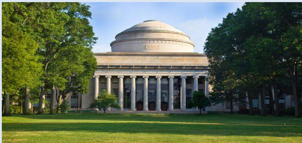
Viện Công nghệ Massachusetts (MIT)

Viện Công nghệ Massachusetts (MIT) của Mỹ đứng thứ 5. Tuy nhiên, MIT vẫn đánh bại các trường nổi tiếng và danh giá như Đại học Harvard. Thậm chí, theo xếp hạng của tổ chức giáo dục QS về các đại học tốt nhất thế giới, MIT liên tục giữ thứ hạng cao nhất suốt 5 năm liên tiếp.