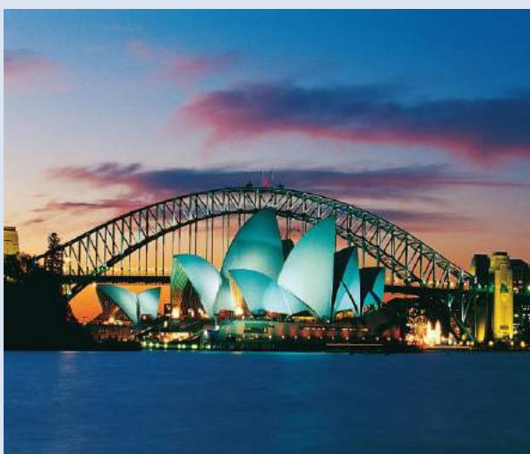
Nhà hát con sò tại thành phố Sydney, Úc

Đến với nước Úc xinh đẹp, chắc chắn các bạn sẽ có rất nhiều những trải nghiệm tuyệt vời tại đây, nhất là với những người lần đầu đặt chân đến xứ sở này. Có đôi chút khác biệt về khí hậu do mùa hè tại Úc kéo dài từ tháng 12 cho đến tháng 2 năm không hề khắc nghiệt mà rất chịu. Bạn sẽ có cơ hội được chiêm ngưỡng vẻ đẹp hiền hòa của bãi không gian trong đi bộ dọc bờ biển tận hưởng những nhẹ dịu của vùng