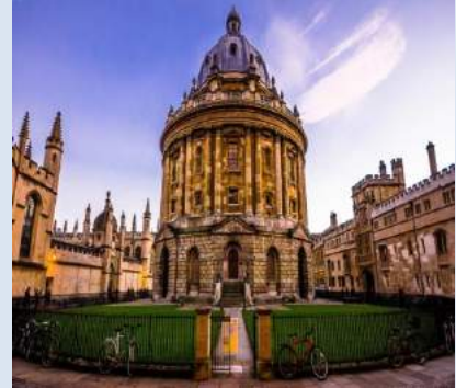
Đại học Oxford

Tạp chí giáo dục hàng đầu của Anh -Times Higher Education (THE) vừa công bố bảng xếp hạng các trường đại học hàng đầu thế giới năm 2018. Theo đó, Đại học Oxford của nước Anh ( ảnh bên ) tiếp tục nắm giữ vị trí đầu bảng năm thứ 2 liên tiếp. Các tiêu chí xếp hạng bao gồm giảng dạy, nghiên cứu, chuyên nhượng kiến thức, thành tích, đánh giá quốc tế và thu nhập.