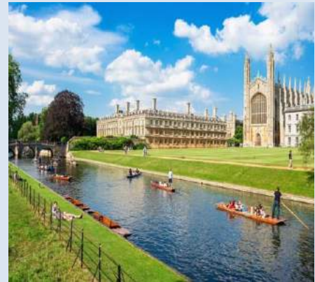
Đại học Cambridge

Đại học Cambridge có cuộc soán ngôi ngoạn mục khi nhảy từ vị trí thứ 4 lên vị trí thứ 2. Đây là lần đầu tiên trong 14 năm, Vương quốc Anh có 2 trường đứng đầu trong bảng xếp hạng. Lý do của bước nhảy vọt này là do thu nhập và chất lượng nghiên cứu của Đại học Cambridge được cải thiện trong năm 2018.