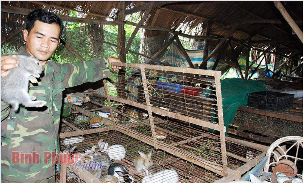
Chuồng nuôi thỏ con của gia đình anh Châu

Anh Châu cho biết để nuôi thỏ thịt lâu dài, đạt hiệu quả cần kết hợp mua giống tại địa phương và các nơi khác như ở Bình Phước, Bến Tre và Tiền Giang. Mỗi nơi thỏ có ưu điểm khác nhau, ví dụ, con đực bắt ở Bến Tre thì con cái bắt ở tỉnh Tiền Giang hay Bình Phước. Ưu điểm của giống thỏ ta là nhanh đẻ, khoảng từ 6 đến 8 lứa trong năm. Thỏ ta có trọng lượng phù hợp thị trường tiêu dùng, đến kỳ xuất chuồng bình quân nặng từ 2,5 đến 3kg/con nên các nhà hàng ưa chuộng, dễ chế biến.