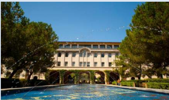
Viện Công nghệ California

Đại học Stanford vẫn giữ vững thứ hạng của năm 2017. Đây là một trong những trường có khuôn viên rộng nhất ở Mỹ và là một trong các trường đại học uy tín nhất thế giới. Khuôn viên trường gồm 700 tòa nhà phục vụ công tác giảng dạy, học tập, nghiên cứu.