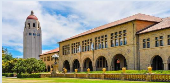
Đại học Stanford